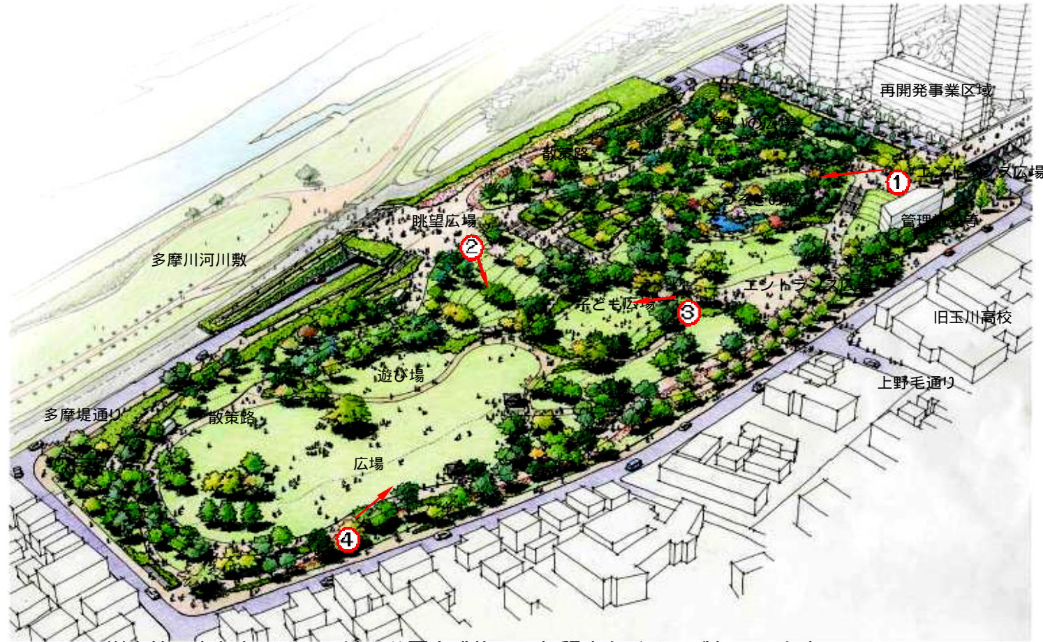
公園イメージ (野毛三丁目から公園への眺め)

樹木等の大きさについては、公園完成後10年程度をイメージしています。 図中の番号はイメージスケッチの視点方向をあらわしています。