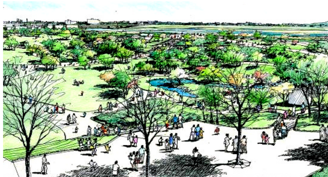
二子玉川駅方面エントランス上空からの眺め