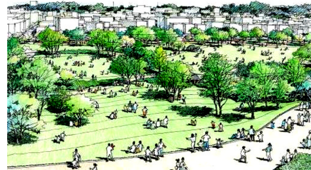
展望広場上空から国分寺崖線方面への眺め

樹木等の大きさについては、公園完成後10年程度をイメージしています。 図中の番号はイメージスケッチの視点方向をあらわしています。