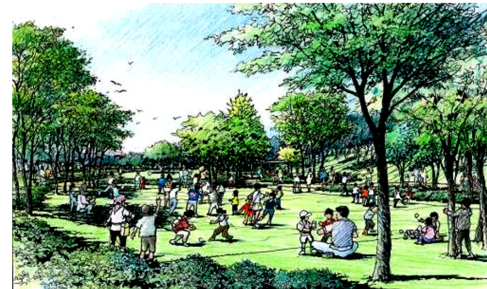
ボールを使った遊びもできる子ども広場