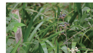
ヤブミョウガの実