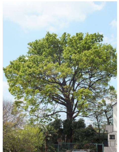
名木百選にも選定されているケヤキ

保存樹木の中には、区の名木百選に選ばれる等、長年地域の方々に親しまれている樹木も多くあります。地域の大切なみどりを次世代へ継承していくため、これからも保存樹木制度にご協力いただけますよう、よろしくお願いいたします。