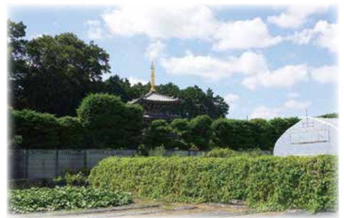
慶元寺三重塔の見える風景