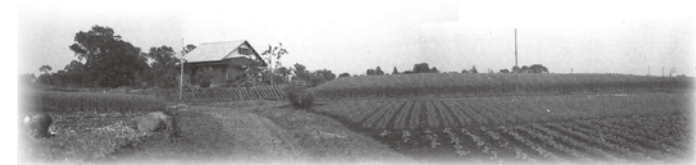
喜多見4-20付近より東方を見る(1959(昭和34)年)

市場に出荷する農産物は事情の許す限り、都心に近い神田・京橋・青山方面へ持って行っていました。夜11時頃に出発して、翌朝市場に到着するのが喜多見の人々の常識でした。1921(大正10)年頃からは牛車を使って市場へ運びましたが、市場が遠く、かつ、夜中はちょうちんの明かり、帰りは下肥を運んでくるため、砂利道や坂で難儀したそうです。