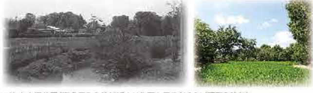
▲次大夫堀公園(喜多見5-26)付近より北西を見る(1961(昭和36)年)

次大夫堀公園 マップ:B-1・2・C-2 次大夫堀は江戸の初期、小泉次大夫の指導で開削された農業用水です。野川から取水して、昔ながらのきれいな流れを復元し、その流れに沿って当時の古民家や水田を配置しています。園内の民家園では江戸時代後期から明治時代初期にかけての農村風景を再現しています。農村に伝わる行事等もっており、昔ながらの生活や風習を体験することができます。また、園内の里山農園は誰もが一緒に楽しめる農園で、食育や環境教育等のプログラムを実施しています。