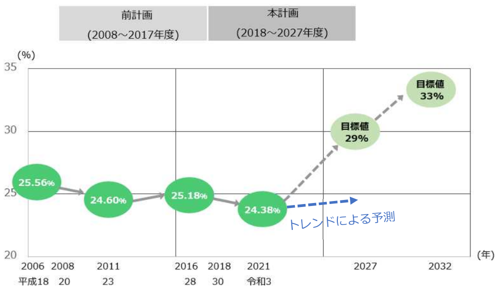
【図】みどりの目標量の達成状況