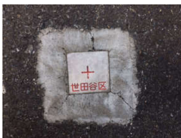
(アルミセットパイル製)