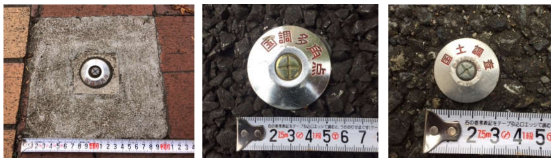
図根多角点本点(Φ50mm) 図根多角点(Φ50mm) 細部図根点【二次】(Φ30mm)