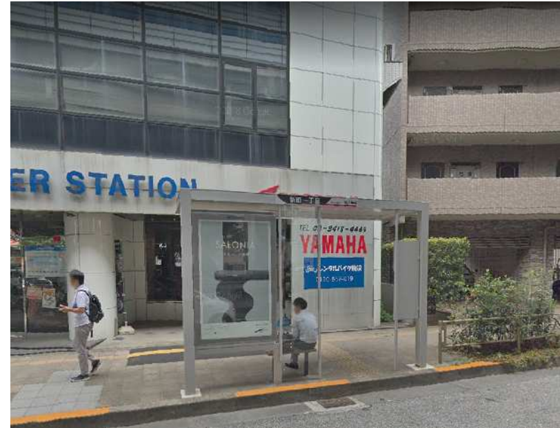
(国道246号線沿いの設置例)