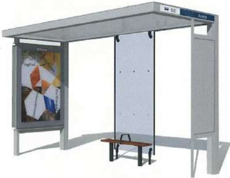
広告板一体型 バス停上屋 イメージ