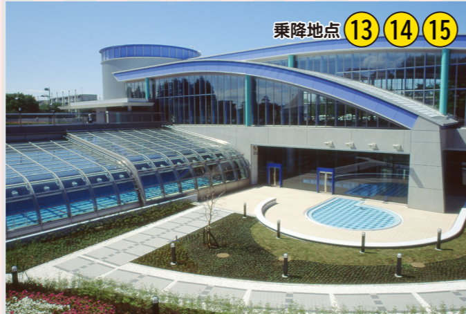
乗降地点 13 14 15

砧公園の一角にあり、アンリ・ルソーを代表とする素朴派や区ゆかりの美術家の作品などを展示する収蔵品展や大規模な企画展を開催しています。また、レストランやカフェも併設されており、音楽会などの催し物や美術大学などの講座など、幅広い活動を行っています。