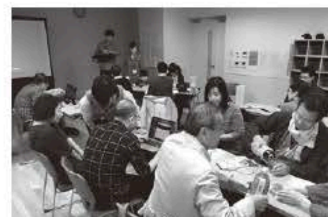
発表用のみんなに見せたい写真を話し合う