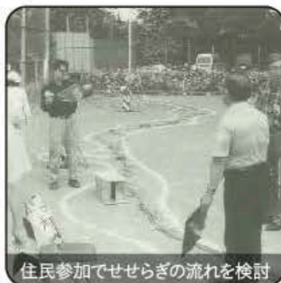
住民参加でせせらぎの流れを検討

現在も住民たちで結成された「グループねこじゃらし」によって維持管理が行われる、地域に根ざした公園になっています。