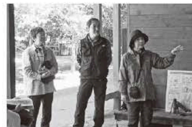
三宿の森を育てる会のみなさんが活動紹介

普段とは異なる視点で写真を撮ることで、参加者それぞれ新しい風景や写真の撮り方を発見できたようです。