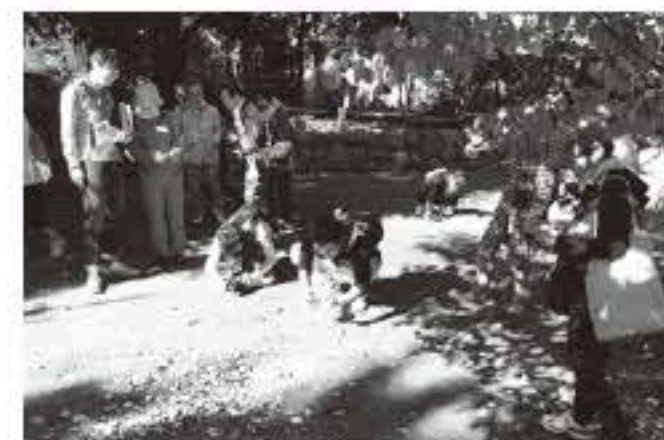
手鏡を使った撮影方法を教わりすぐ実践