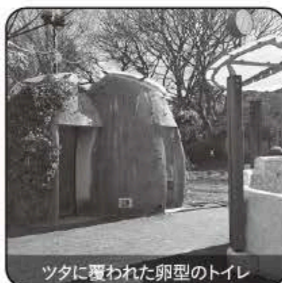
ツタに覆われた卵型のトイレ