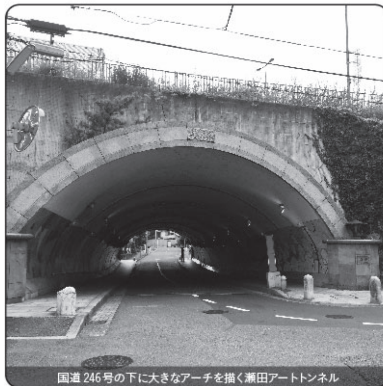
国道246号の下に大きなアーチを描く瀬田アートトンネル

瀬田の街並みを南北に横断する国道246号の下を通り抜け、東西をつないでいる「瀬田アートトンネル」。中を通ると、壁面を彩る淡い色のモザイク画が目にも楽しく、まるで明るい回廊のような空間が広がっています。