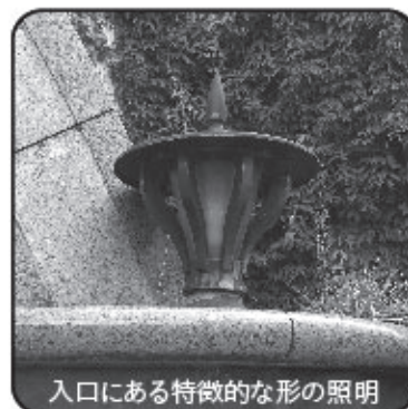
入口にある特徴的な形の照明

「暗い、汚い、危ない」という元々のトンネルのイメージを刷新するような現在の風景が生まれたのは、平成5年12月のこと。出入口のアーチと頂点に飾られたレリーフには御影石が施され、夜間はライトアップによって美しいアーチ型を浮かび上がらせます。空間に溶け込むように淡い色が施されたモザイク画は、地元の美大生4人のグループによる「多摩川と国分寺崖線」をテーマにしたデザイン。天井と壁面に向けられた照明がやわらかい反射光になって昼夜ともに明るく、駅やショッピング街へ向かうために東西を行き来する多くの人々に親しまれています。