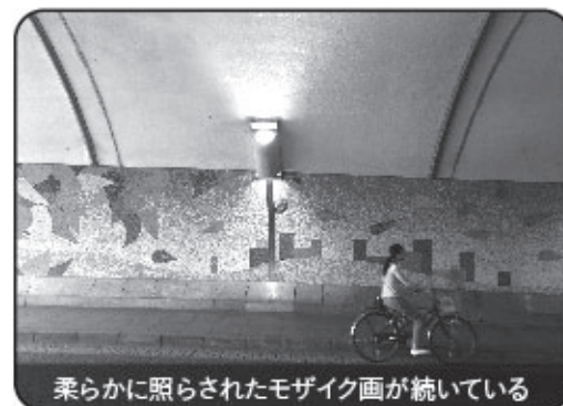
柔らかかに照らされたモザイク画が続いている