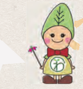
おくさ「わ」風景キャラクター わっこちゃん