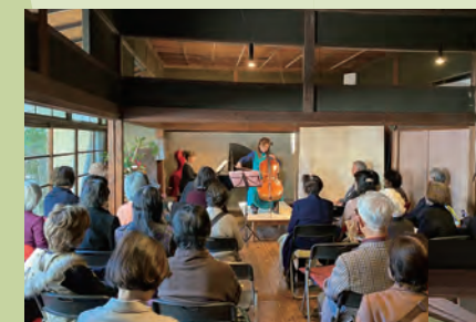
【同日開催の晩秋のつどい (コンサートと「奥沢の歴史」の講座)】