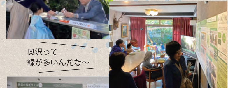
奥沢って緑が多いんだな~