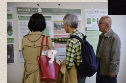
パネル展示とスタッフの説明により奥沢の風景づくりの取組みが紹介されました。