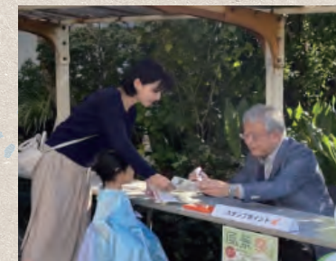
ご来場ありがとうございます。スタンプをどうぞ!