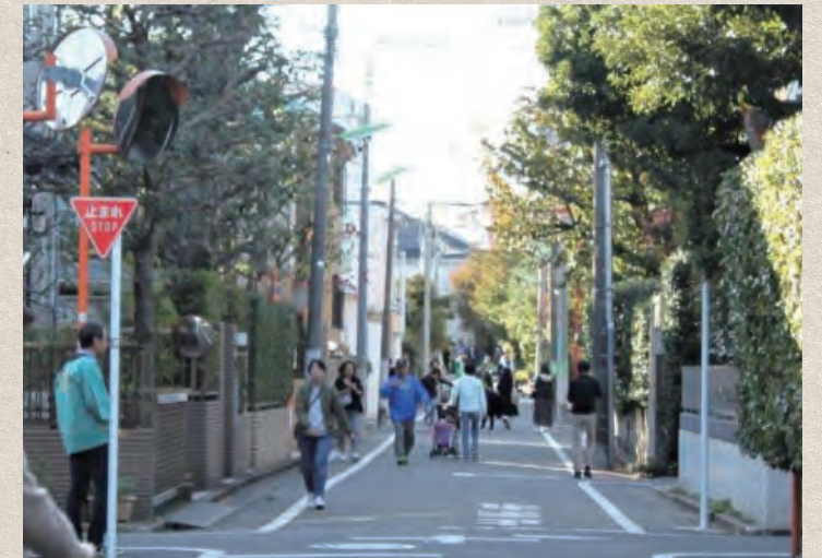
普段の通りの風景とは一変。この日は奥沢2丁目界わい全体が多くの人で賑わいました。