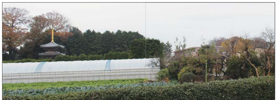
みどりと歴史的資源が一体となった風景（喜多見）