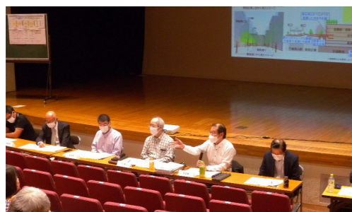
準備会での運営委員からの説明の様子

千歳烏山駅前広場南側地区まちづくり準備会では、京王線連続立体交差事業や都市計画道路事業でまちが大きく変わる機会を捉え、駅前広場に面する立地を活かし、駅周辺まちづくりの促進につなげ、かつ、土地の有効利用による生活再建を図ることで次世代に引き継いでいくため、この度「再開発事業を活用したまちづくりの基本的な考え方」を取りまとめました。この基本的な考え方を踏まえ、より検討を深める場として再開発準備組合の設立を目指し、現在活動しています。