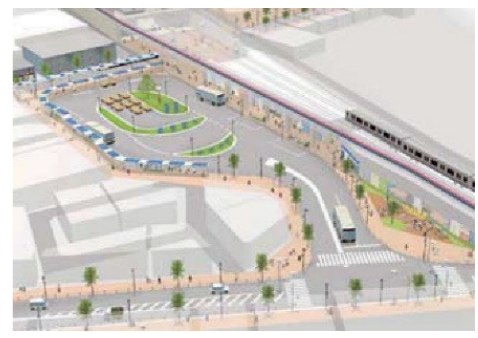
駅前広場整備イメージ ※実際の整備内容を示したものではありません

【目 的】・交通結節点の機能及び南北の交通ネットワークの強化 ・防災性の向上 【内 容】都市計画道路（2車線） 都市計画交通広場の整備 【事業者】世田谷区 【状 況】昭和41年 7月 都市計画決定(補助216号線) 平成24年10月 都市計画決定(駅前広場) 平成26年 2月 事業認可(補助216号線/駅前広場)