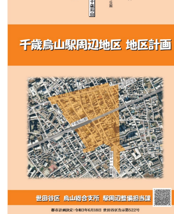
【地区計画パンフレット】