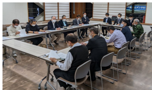
街づくり委員会での意見交換の様子