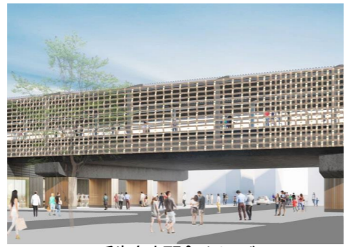
千歳烏山駅舎イメージ

【目 的】・踏切遮断による交通渋滞及び踏切事故の解消 ・鉄道により分断されていた地域の一体化 【内 容】京王線の連続立体交差化（高架方式） 【事業者】東京都 【状 況】平成24年10月 都市計画決定（変更） 平成26年 2月 事業認可 令和 4年 3月 事業認可の変更（期間の延伸） 令和 4年秋頃 工事着手（千歳烏山駅付近）