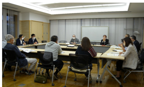
準備会での意見交換の様子