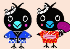
烏山地域キャラクター「からぴょん」

その他:お立ち寄りいただいた方には「からぴょんグッズ」をプレゼントします。※数量限定のため、無くなり次第終了