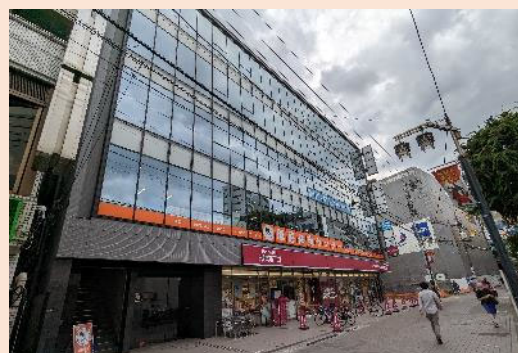
烏山第2倉林ビル 303号室

※上記電話番号は暫定です。次の電話番号が決まりましたら、ご連絡させていただきます。