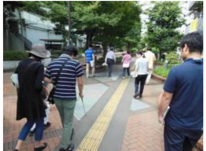
北沢川緑道の誘導ブロック等の確認