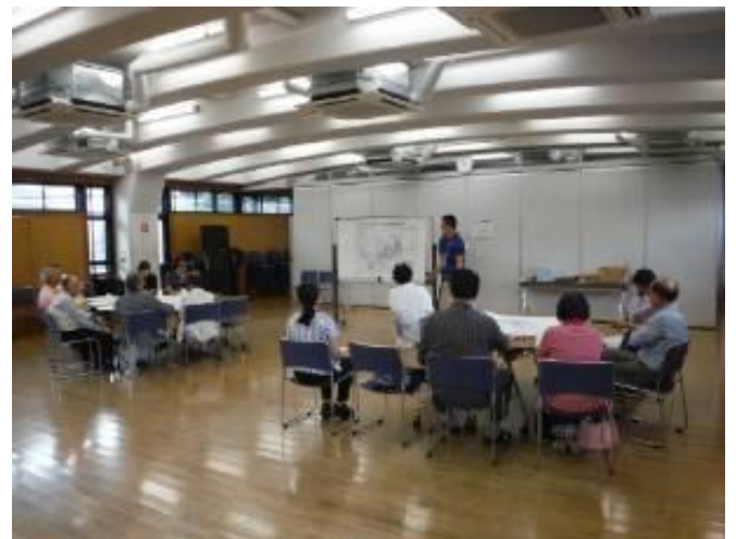
梅丘パークホールでの懇談会の様子