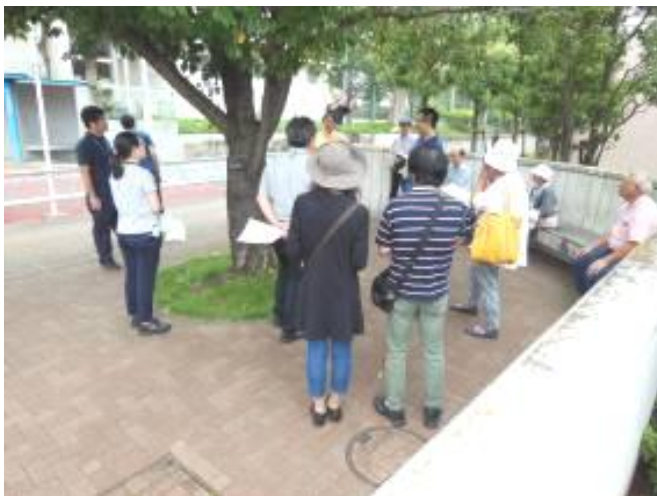
北沢警察署角部のポケットパークの確認