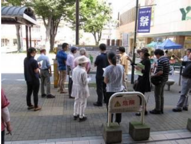
梅ヶ丘駅北口の案内サイン等の確認

平成27年9月12日（土）に平成27年度第1回「梅ヶ丘駅～豪徳寺駅・山下駅界わい街づくり懇談会」を開催し、11名にご参加いただきました。現地にて界わいのユニバーサルデザインを点検した後に、現場点検のまとめを行いました。