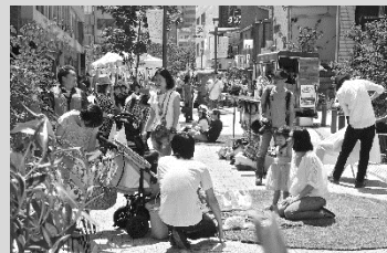
さかさ川通り(大田区蒲田)でのイベントの様子

1980年、東京都生まれ。 建物を建て、それを運営することを基幹に、さまざまな分野での地域づくり、社会事業、文化事業に取り組む。