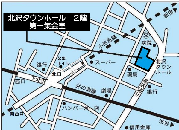
北沢タウンホール2階 第一集会室