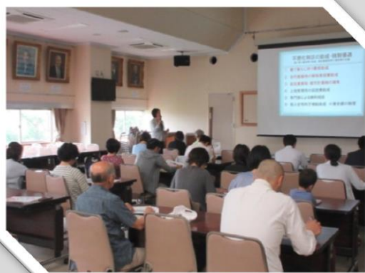
6月23日開催のミニ講座 「考えてみませんか？二世帯住宅」の様子