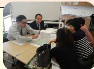
<昨年度の相談会の様子>