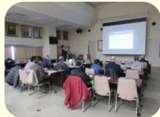
<昨年度のミニ講座の様子>