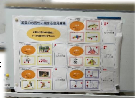
遊具機能に関するご意見