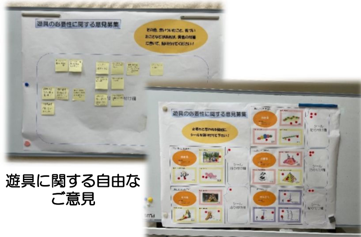
遊具に関する自由なご意見