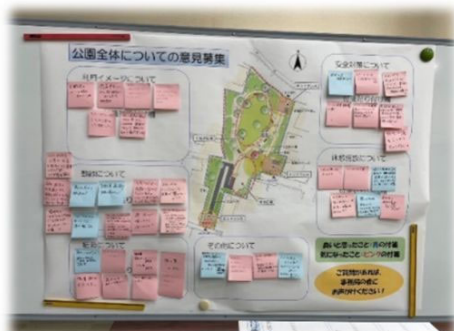
公園全体についてのご意見