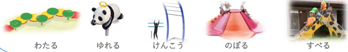
＜中間説明会で遊具機能の説明のために用いたイメージ写真＞