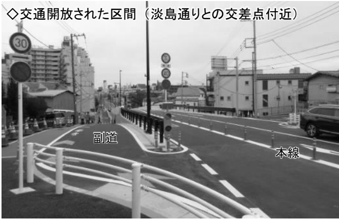
◇交通開放された区間（淡島通りとの交差点付近）