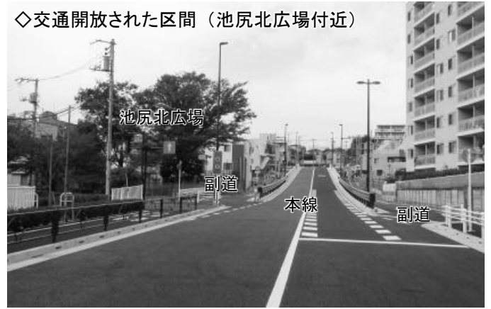
◇交通開放された区間（池尻北広場付近）