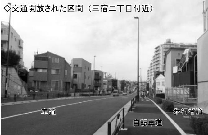
◇交通開放された区間（三宿二丁目付近）