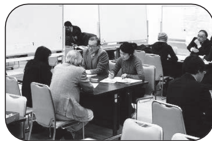
<過年度の相談会の様子>