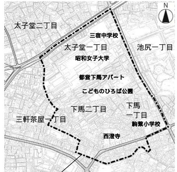
地区計画等決定区域 太子堂一丁目全域、 下馬一丁目の一部(28~44番) 下馬二丁目の一部(1~16番、19~44番) 三軒茶屋一丁目の一部(5~7番)

また、同地区について、東京都により東京都建築安全条例に基づく「新たな防火規制」の区域に指定され(平成27年12月25日告示)、平成28年1月25日から施行されます。新たな防火規制の概要につきましては、裏面2ページの をご覧ください。