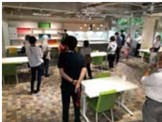
オープンキッチンのある フリースペース