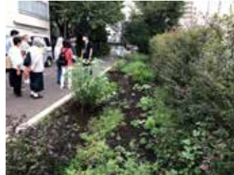
敷地の一角を活用した畑

後半は、まもりやまテラスを見学しました。「オープンキッチンのあるフリースペース」「敷地の一角を活用した畑」など、花見堂でどのように活用されるかをイメージしながら、意見交換を行いました。