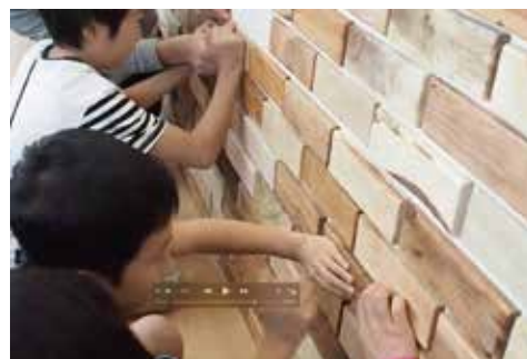
ウッドブロックで壁を飾った事例 子どももたくさん参加した