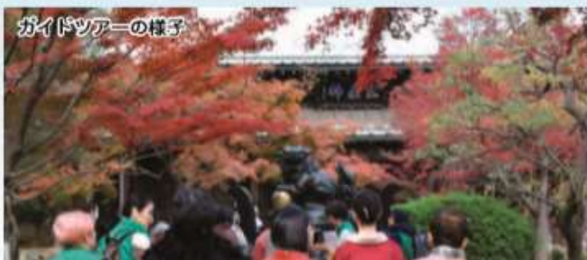
ガイドツアーの様子