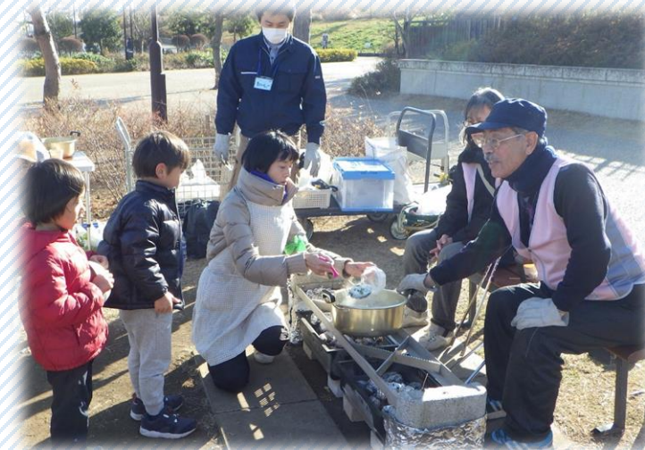
▲利用体験イベント (二子玉川公園)