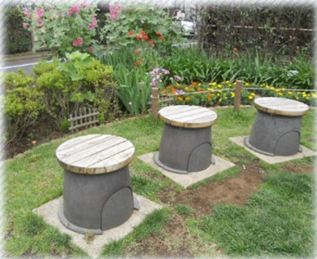
▲かまどスツール (若林ふれあいひろば公園)