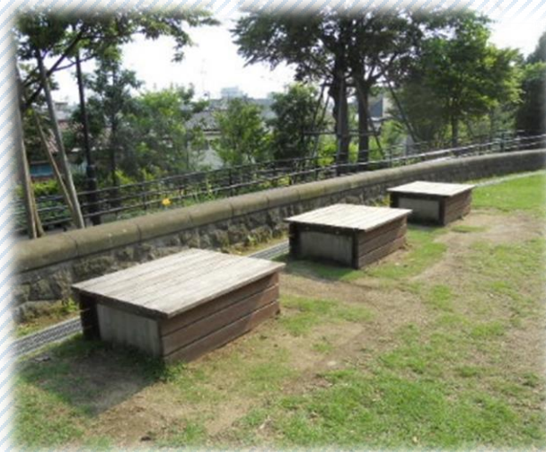
▲縁台型のかまどベンチ (太子堂円泉ヶ丘公園)