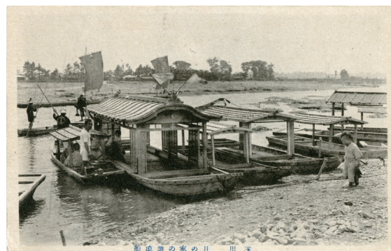
絵はがき③ 玉川 月の家の涼遊船