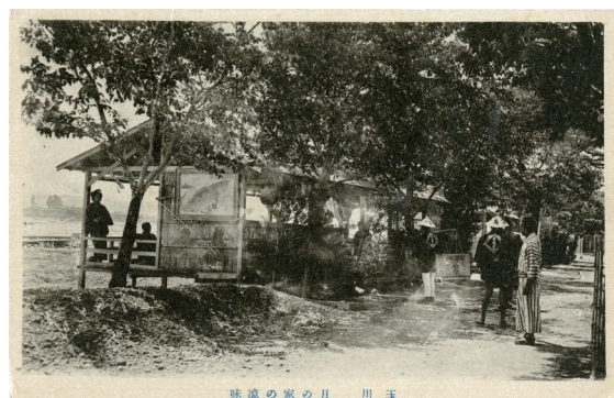
絵はがき② 玉川 月の家の涼味