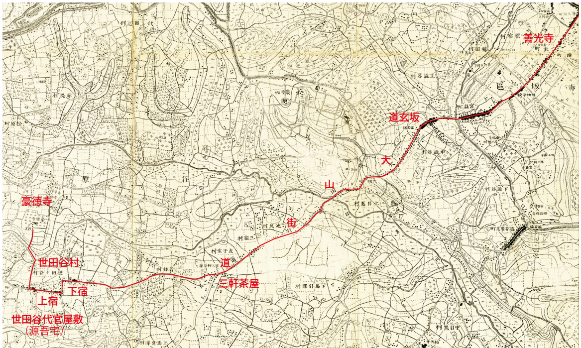
【図1】豪徳寺までの推定経路（二万分一地形図「東京近傍第八号 内藤新宿」部分に加筆）

昼過ぎ、下宿で使う夜具を運んできた馬や藩役人らが続々と世田谷へ到着した。そして暮れごろから、寺では遠見の者の注進に従い、棺を迎える準備が着々と進んでいく。諸役人衆は本堂や中門などへ詰め、両代官と道案内名主らも中門外の稲荷社（「いなり」）の所で平伏した（【図2】参照）。