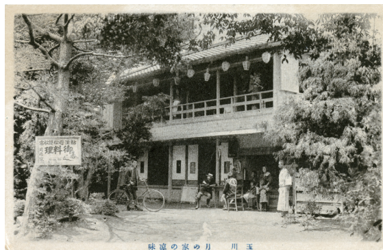
絵はがき① 玉川 月の家の涼味