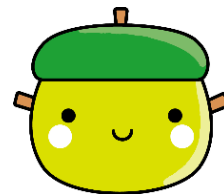
せたがや離乳食研究員 モグモ