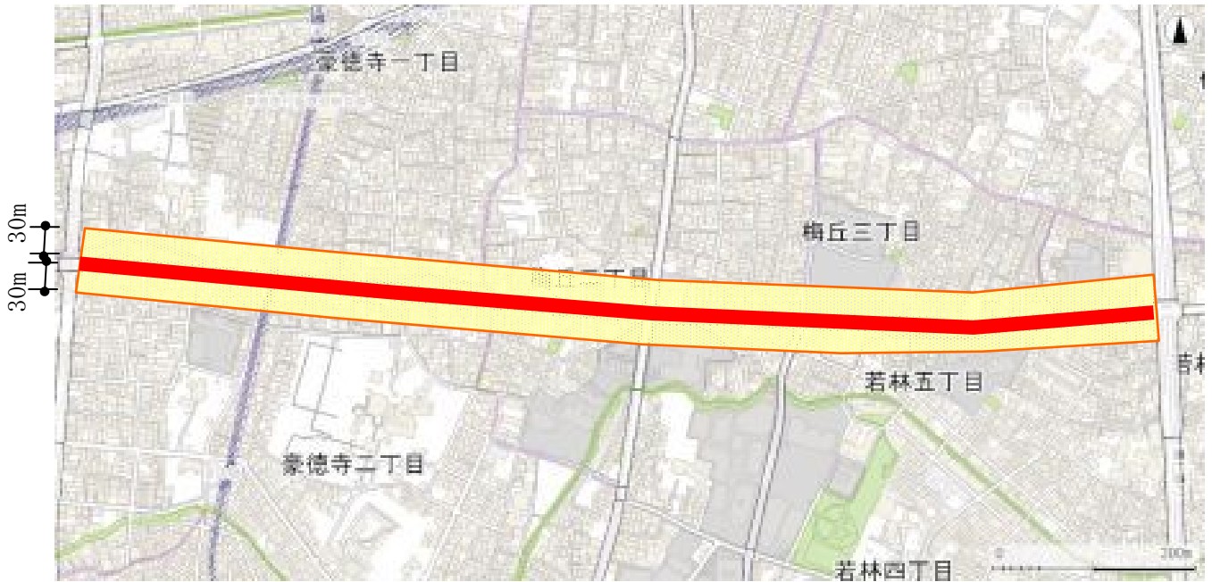
図-1 補助52号線沿道地区の区域図