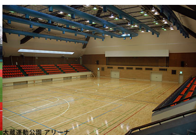
大蔵運動公園 アリーナ