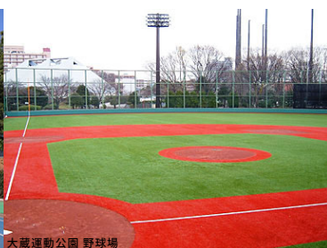
大蔵運動公園 野球場