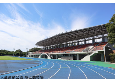
大蔵運動公園 陸上競技場