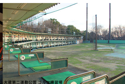
大蔵第二運動公園 コルテオ練習場