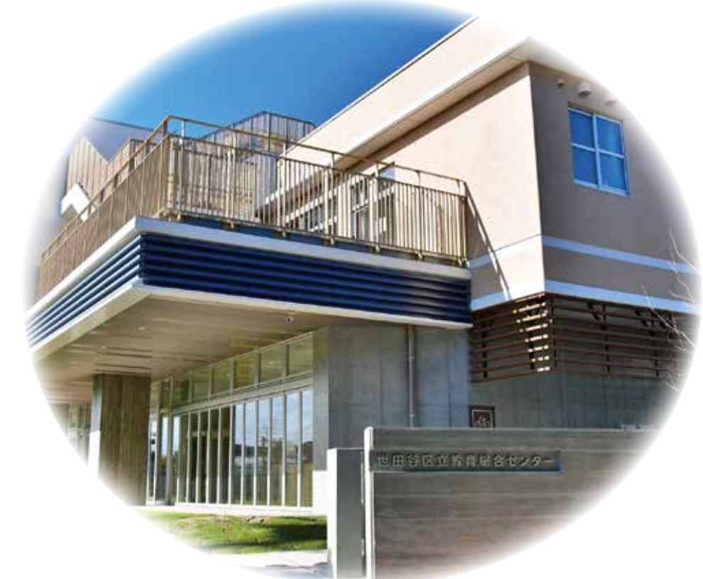
▲教育総合センターの開設