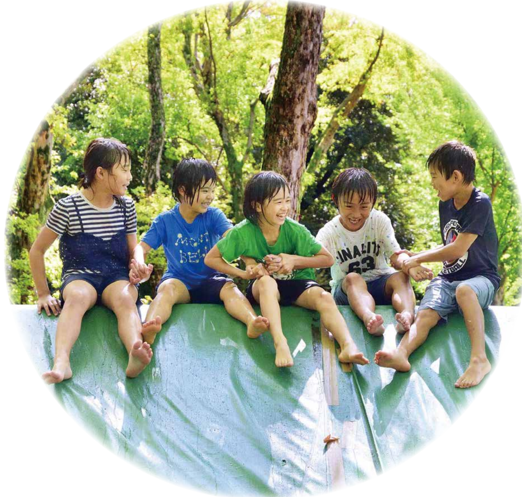
▲「子どもが輝く 参加と協働のまち せたがや」