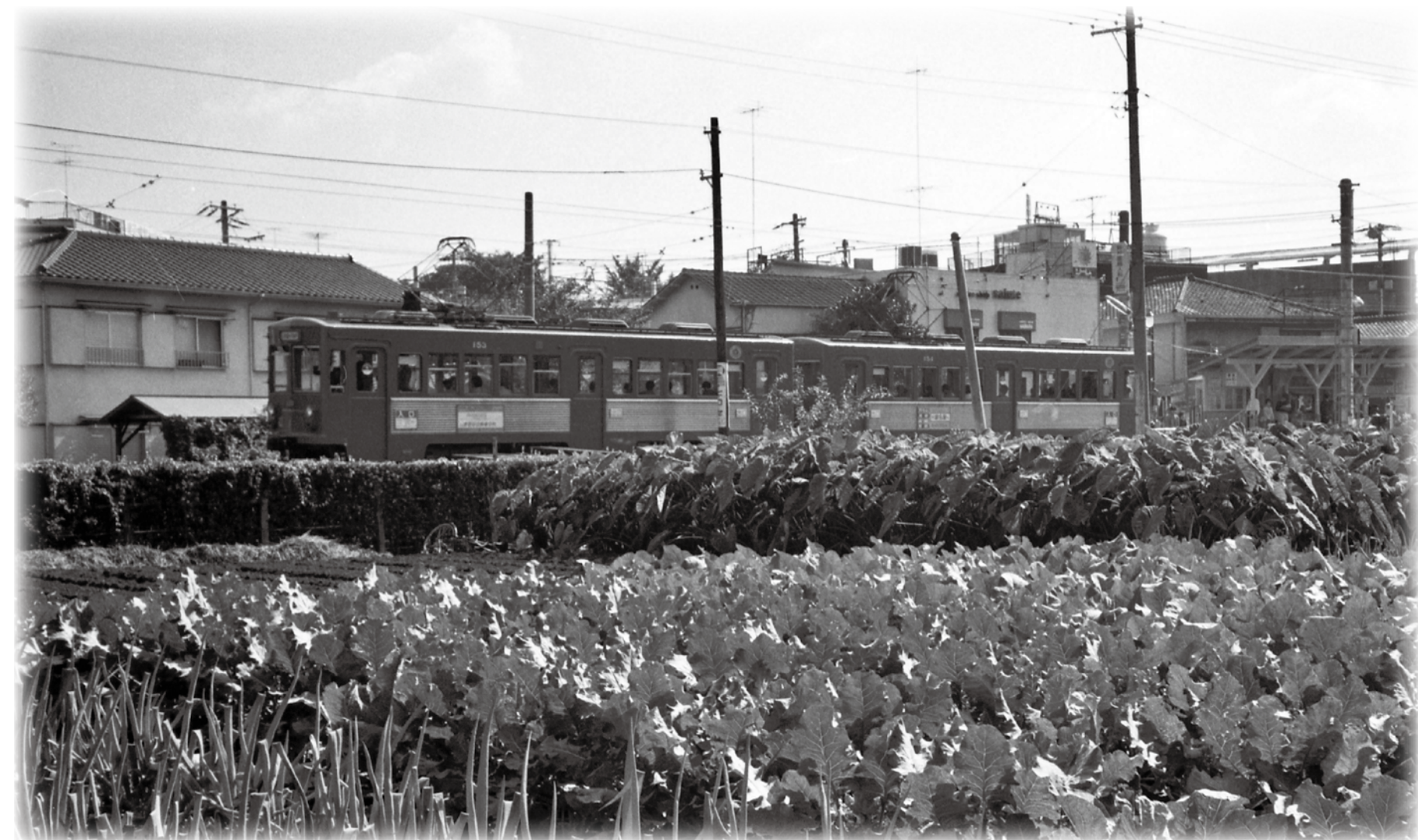
▲豪徳寺駅・山下駅周辺（昭和60年代）