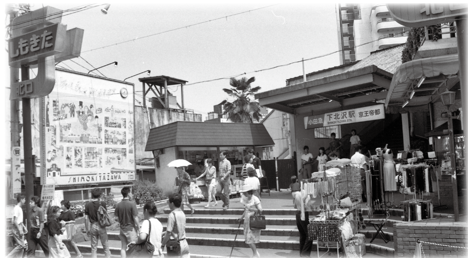
▲下北沢駅（昭和60年代）

世田谷区では、区制100周年を見据えた令和6年度を初年度とする新たな基本計画の策定に向け、検討を進めています。