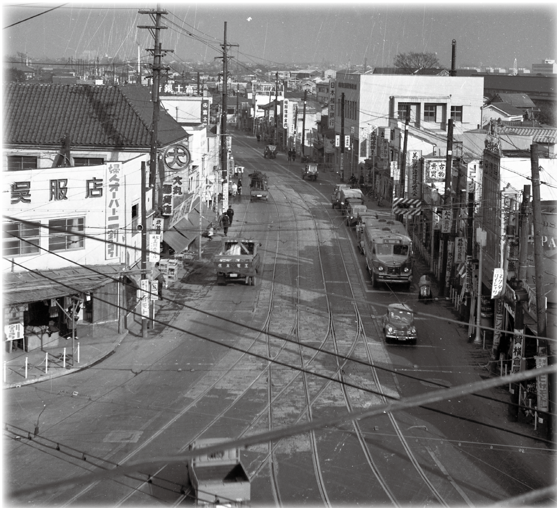
▲三軒茶屋交差点（渋谷方面）（昭和30年代）