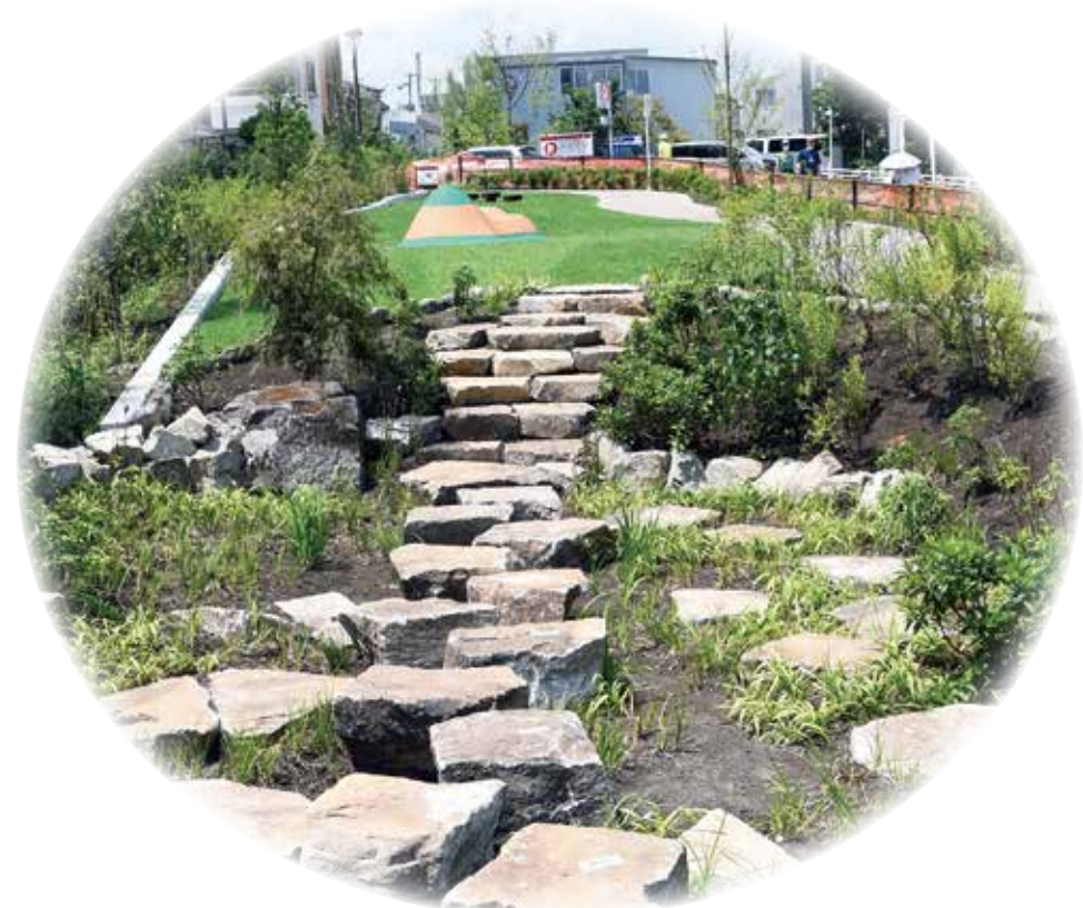
▲災害に強いまちづくり(下北沢駅周辺のまちづくり)

昭和7年10月1日、東京市(当時)の区域拡張により世田谷区が誕生し、今年で90周年を迎えました。10年後の区制施行100周年に向け、一層発展していきます!