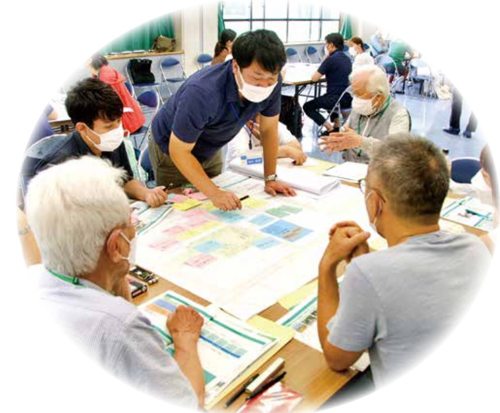
▲区民参加のワークショップ