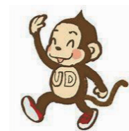
【世田谷区ユニバーサルデザイン 普及啓発キャラクター「せたっち」】