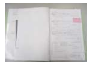
レファレンスファイル

サービスレベルの向上を図るため、レファレンス調査成果を既定のフォームに記載し、ファイリングします。ここではレファレンスを受けた件数だけでなく、質問に対する調査プロセスと回答内容を記録することで、スタッフ間のノウハウ共有を容易にし、集団としてのレファレンス能力の向上へ繋がります。また、館内整理日でのスタッフミーティングや集合研修では、責任者がファイル等から有用な事例を抜粋して全体のレベルアップのため活用します。