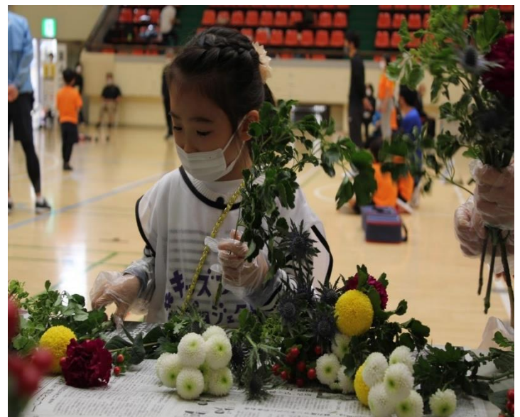
キッズブーケプロジェクト