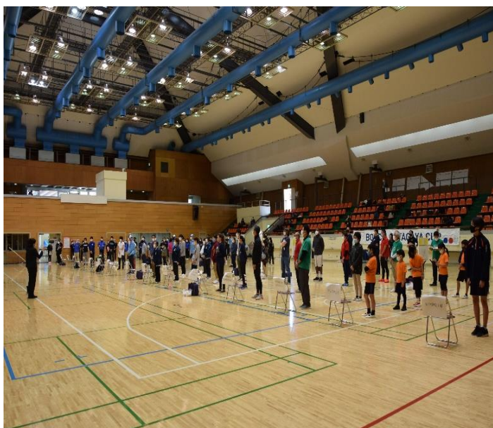
試合前の全体説明の様子