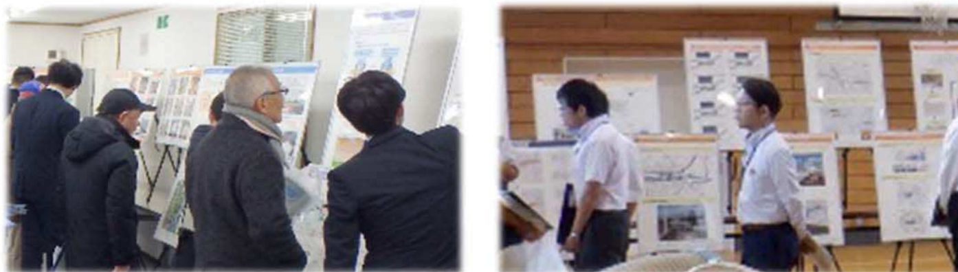
オープンハウス(出張説明会)(イメージ)