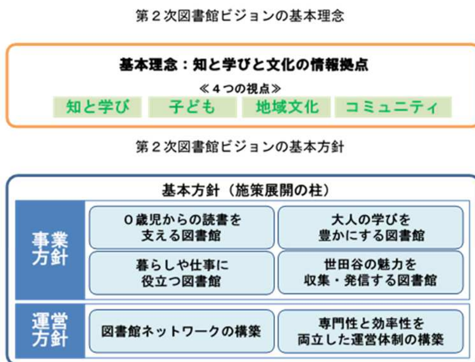
図 1-1 『図書館ビジョン』の基本理念・基本方針

平成27年4月には、新たな図書館像を示す長期計画として『図書館ビジョン』を策定し、「知と学びと文化の情報拠点」を基本理念に掲げています。基本理念は、図書館の公共性の観点に立ち、子どもが本に親しみ、豊かな精神的成長を助けるとともに、大人の知的欲求と学習意欲に応えるものです。さらに、読書や地域文化の情報収集と発信を通じて世田谷の魅力を見出し、それらの活動や文化の担い手となるコミュニティの醸成につながる交流の場所、地域に開かれた知的な居場所をめざすとしています。基本理念における4つの視点や基本方針（施策展開の柱）を、次の図のとおり示しています。