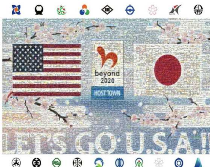
米国ホストタウン オンラインシンポジウム