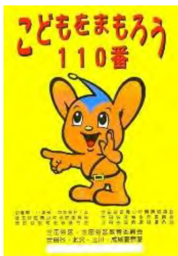
図表 9-4 子どもを守ろう 110番ステッカー