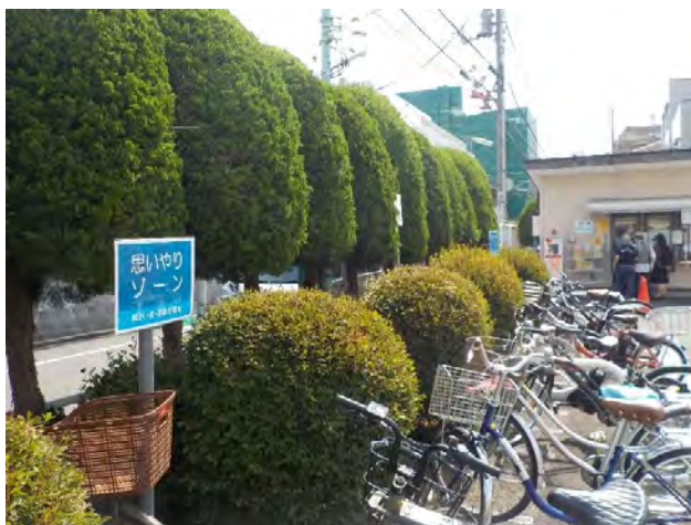
図表8-53 思いやりゾーン