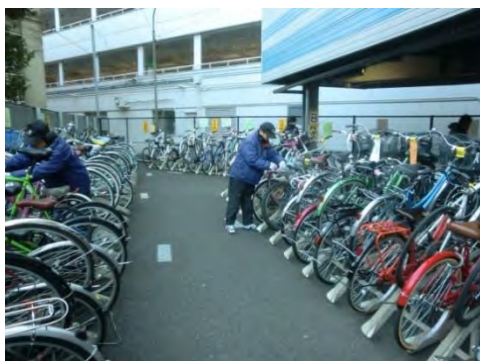
図表 8-49 自転車等駐車場における業務の様子