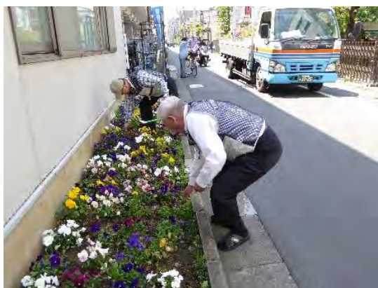
図表8-52 緑化推進活動