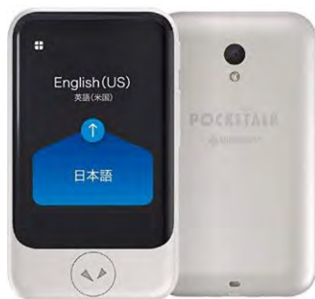
図表 9-5 自動翻訳機

世田谷区に住民登録している外国人は 23,000 人を超え、さらに増加傾向にあります。区内の外国人や観光客に対応できるよう、主要な自転車等駐車場にポケット型の自動翻訳機を配備します。