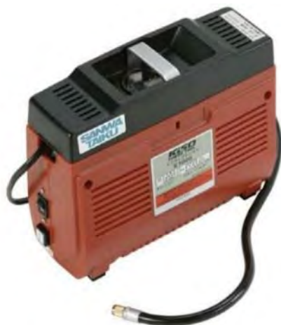
図表 9-1 エアーコンプレッサー