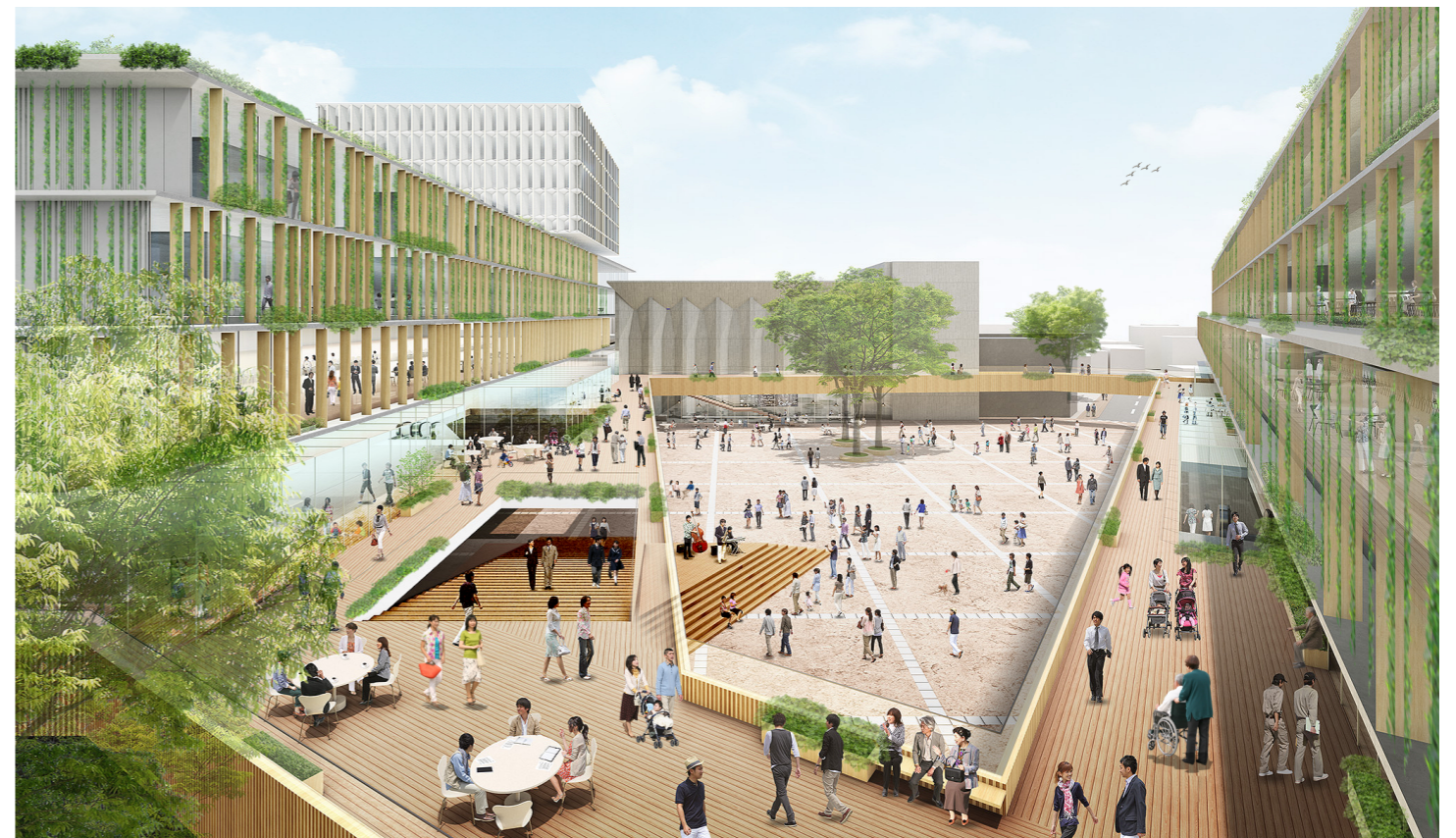
■区民の活動の舞台「世田谷リング」(プロポーザル提出時)