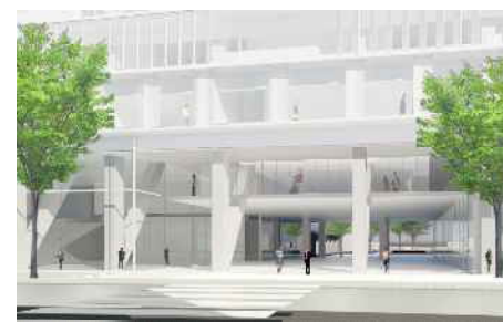
区民を迎え入れるゲートとなる東棟のピロティ

本計画では、周辺環境に対し緑を設け、イベント利用を行う広場を敷地中央に配置します。また、既存建物の空間特質の要素である広場、区民会館、ケヤキ並木、池、ピロティなどを継承・発展させ、次世代に引き継がれる世田谷らしい風景として計画します。