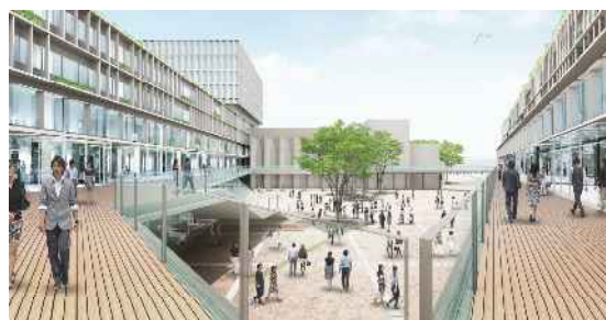
「世田谷リング」でつながる新庁舎と広場のイメージ