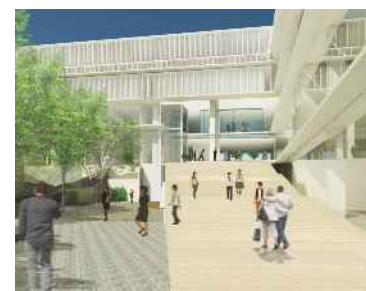
新たにメインアプローチとなる西棟のピロティ