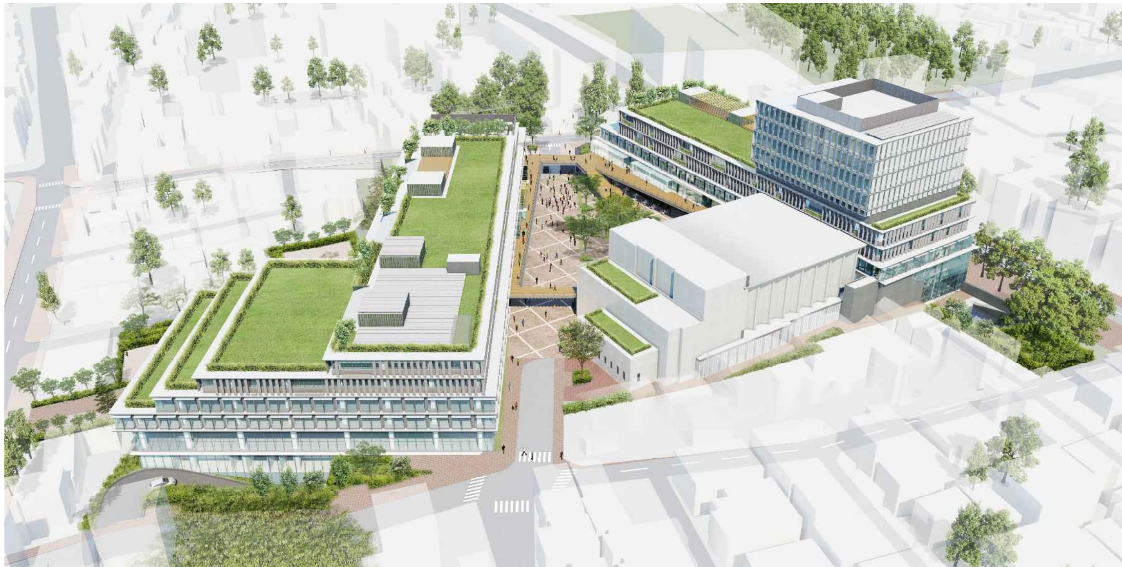
広場を取り囲む東西棟と区民会館の配置計画、敷地周辺の緑・屋上緑化による緑あふれる外構計画