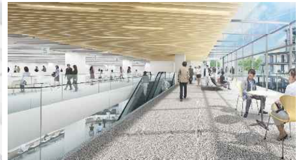
執務室・待合スペースイメージ