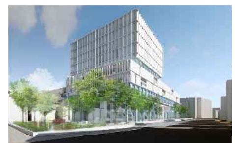
区民、行政、議会機能が独立しながらも相互に連携する新しい庁舎