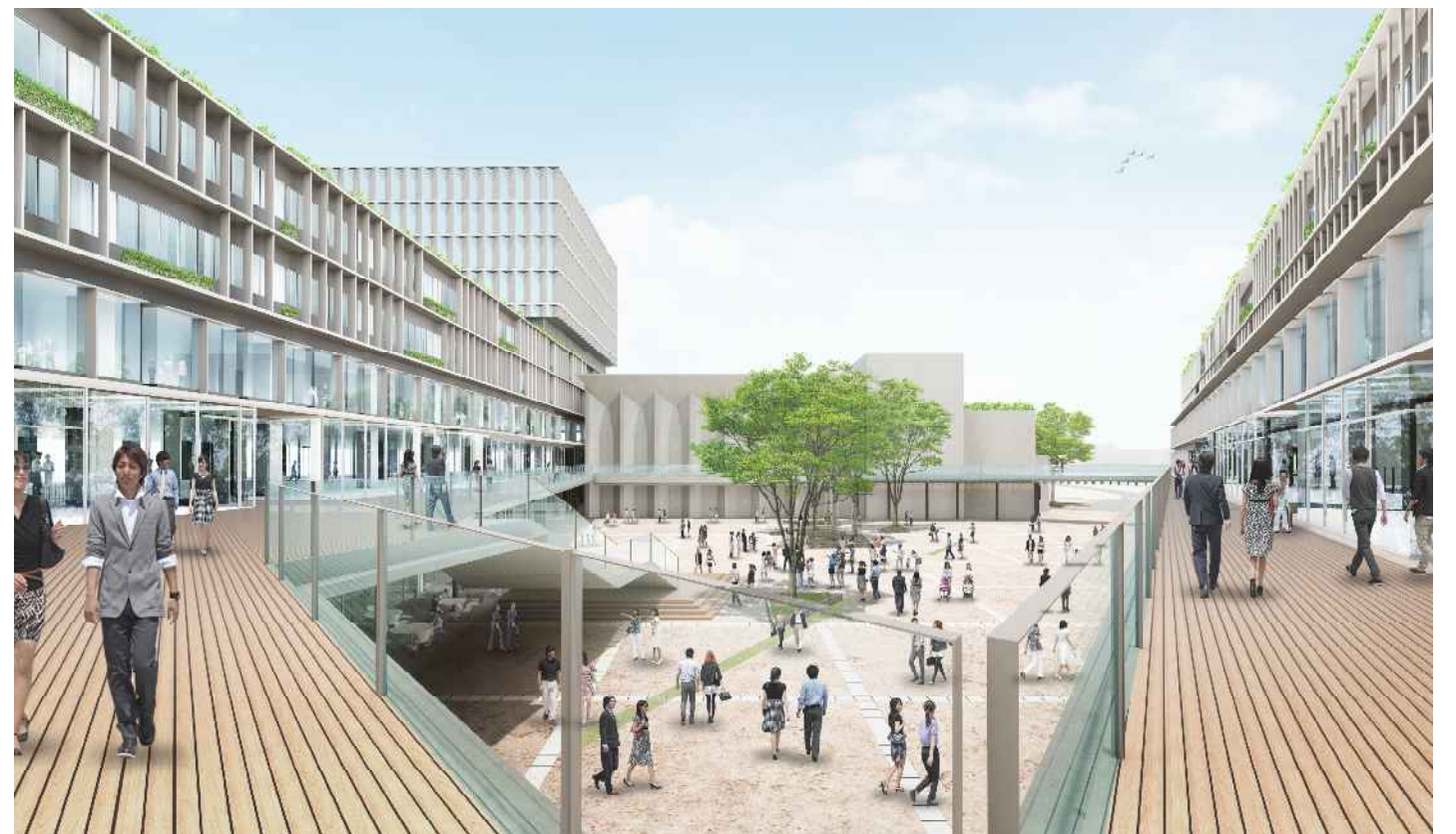
■広場を中心とした建物構成と建物をつなぐ「世田谷リング」