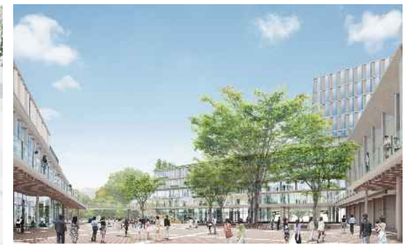
広場イメージ(1階より望む)