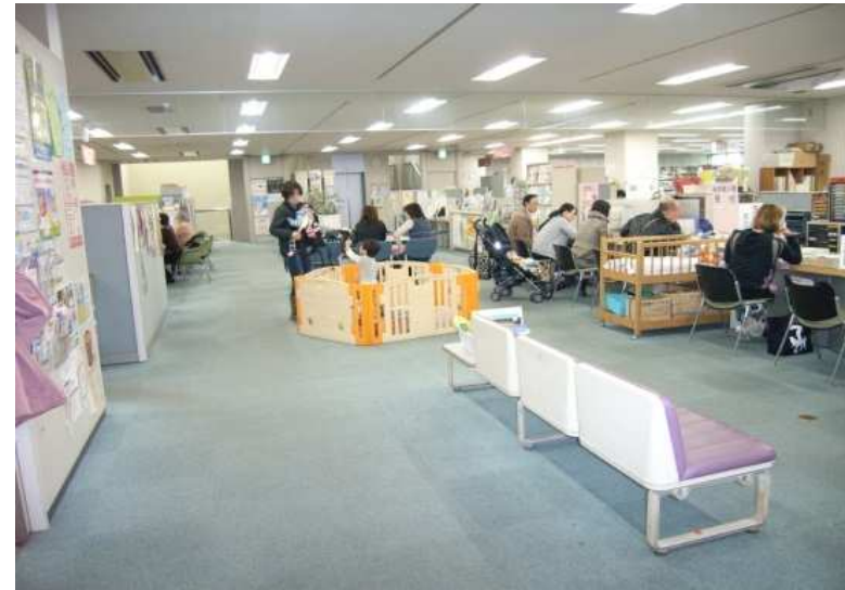
第3庁舎 2階待合スペース