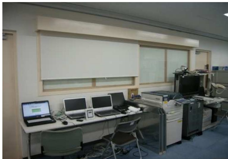
第3庁舎 3階災害対策本部