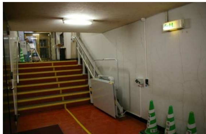
第2庁舎 地下1階階段