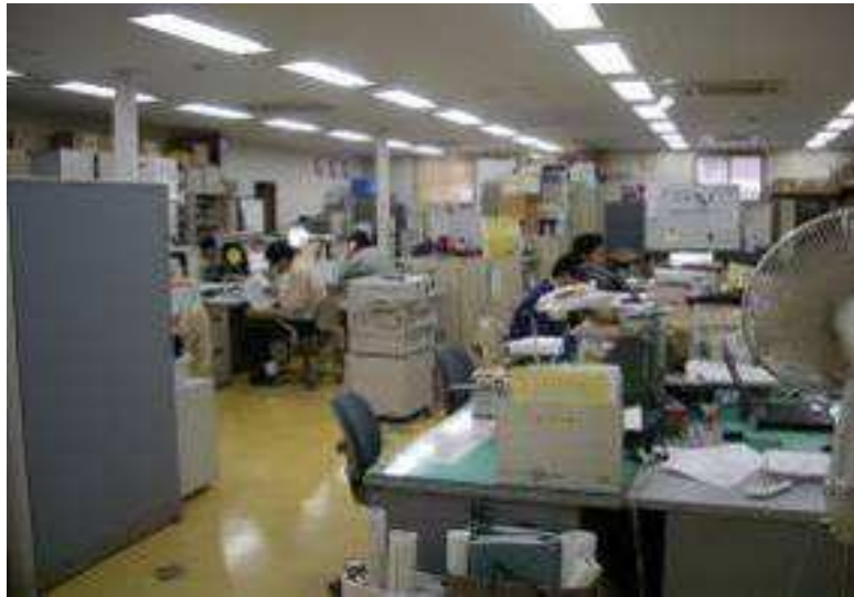
第3庁舎 プレハブ事務室