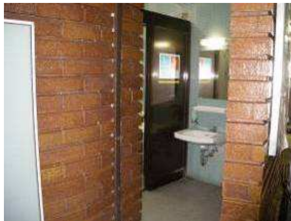
第2庁舎 トイレ入り口