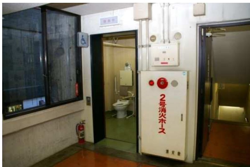
第1庁舎 身障者用トイレ (1階5階)