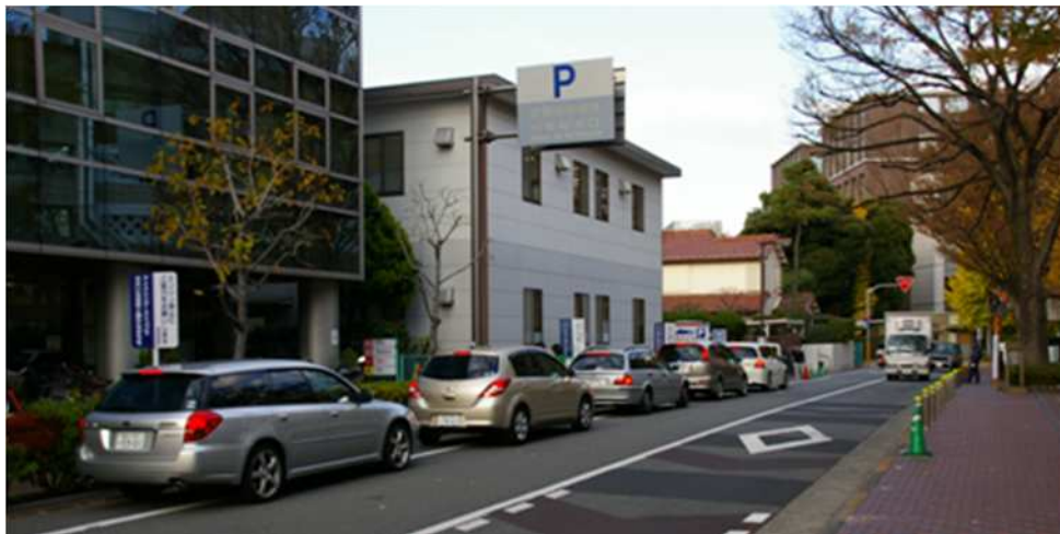
来庁者用駐車場の待機車両