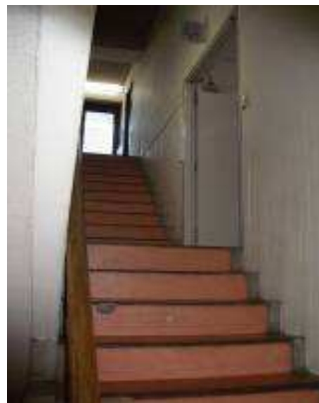
第1庁舎 階段途中トイレ