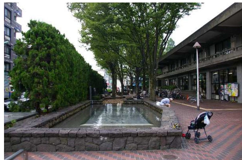
噴水とケヤキ並木