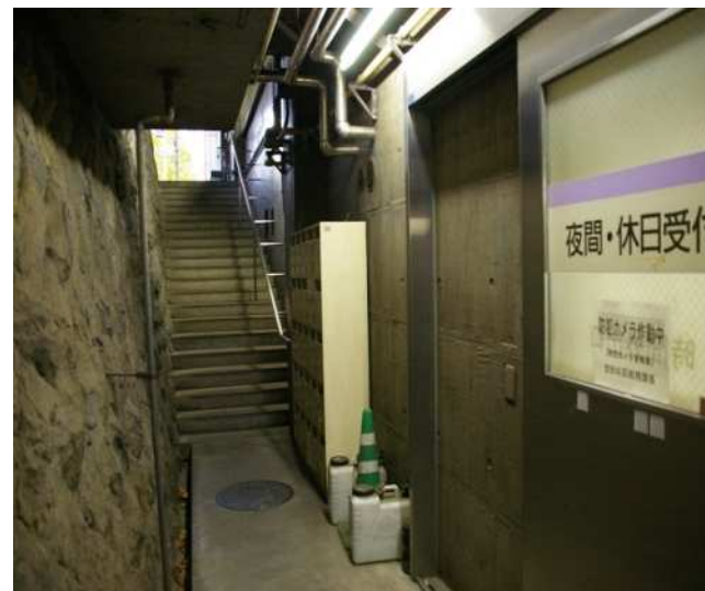
第1庁舎 地下1階 時間外出入口