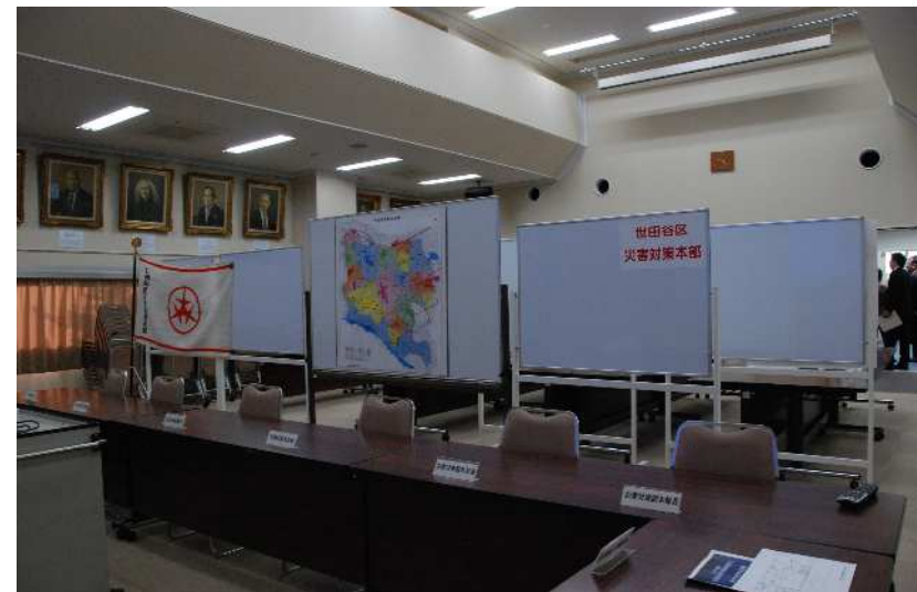
第3庁舎 3階災害対策本部