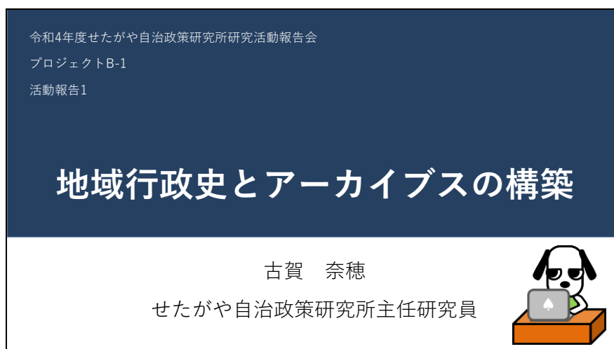
図1 研究活動報告会スライド

以下、本稿では令和3(2021)年度より実施しているインタビュー調査について、1月24日に開催したせたがや自治政策研究所研究活動報告会の発表に沿って報告する(図1)。