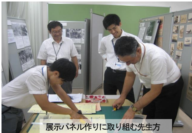
展示パネル作りに取り組む先生方