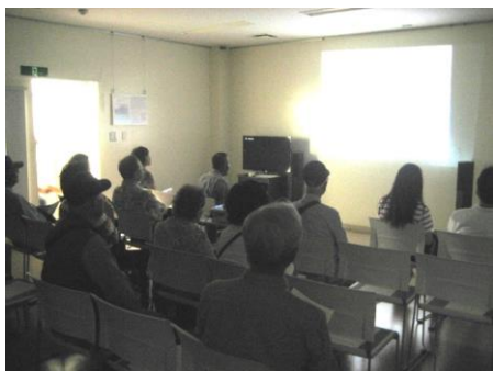
1日目の映画祭会場

今年も7/26～27の3日間平和映画祭を開催し、52名の方にご参加いただきました。参加された皆様から貴重なご感想をいただきましたのでご紹介いたします。