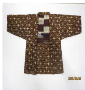
(母親が縫った) 戦時中の子どもの着物