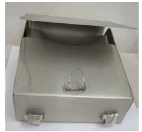
展示品 布製野球グローブ（左）とジュラルミン製ランドセル