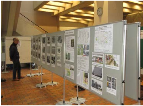
昨年の地域巡回展（烏山区民センター）

8月1日より10月31日まで右記の日程で地域巡回展を行います。 皆様のご来場をお待ちしています。