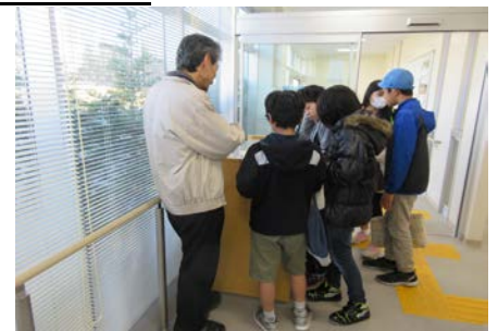
館内で調べ学習をする子どもたち

平和資料館では、夏休みに子どもたちの「自由研究」に利用してもらえよう、今年もいろいろな用意をしています。子どもたちが、授業やテレビなどで見たり聞いたりした戦争のことで、驚いたこと、もっと知りたいことなどありましたら、ぜひ当平和資料館をご活用ください。