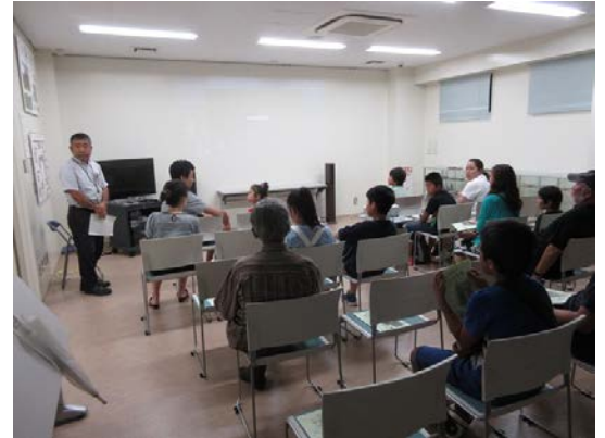
昨年の映画祭(2日目)の会場