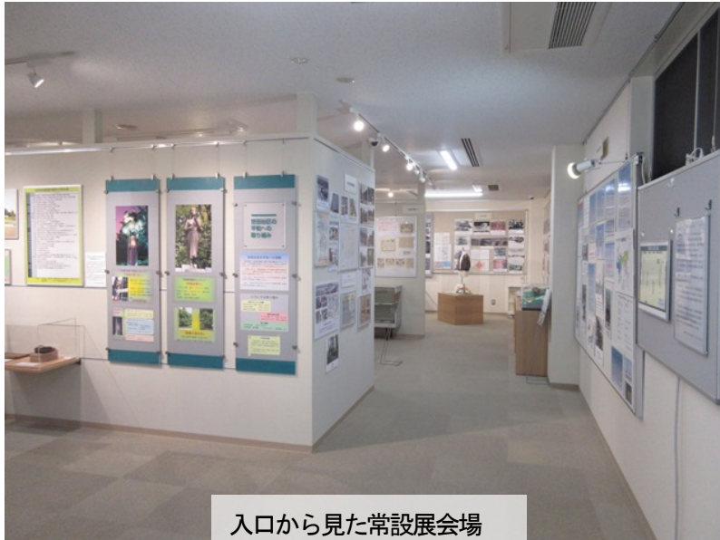
入口から見た常設展会場

また、小さいお子さま・車椅子等の方も安心してゆっくりとご覧いただけるよう、見学順路を設定し通路を広くしました。