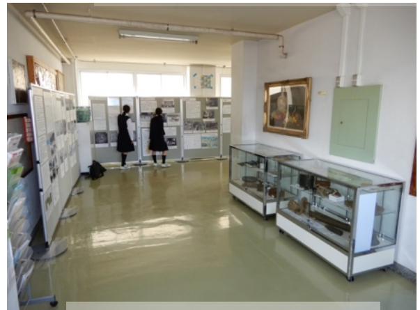
30年度中学校巡回展 駒沢中学校