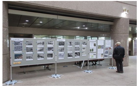
30年度地域巡回展教育センター会場