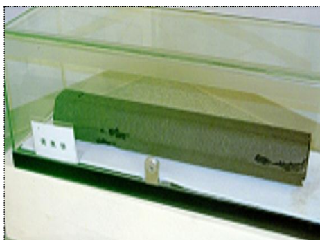
油脂焼夷弾（展示品）

その一部につきましては、展示室に展示しています。また、未展示の資料も巡回展、特別展等で、順次公開していきます。