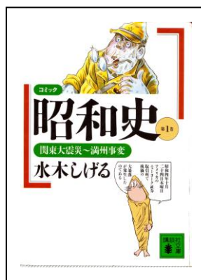
「コミック昭和史」 水木しげる 講談社文庫