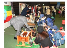
前回の様子

平和関連の絵本やボードゲーム、様々な国、地域の平和について一緒に考えるコーナーがあります。ぜひ遊びに来てください。