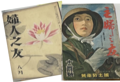
入口特設コーナーに展示しています

戦争は女性の暮らしにも大きな変化をもたらしました。戦地へと徴兵されていく男性に代わり、軍需工場への労働など、さまざまな仕事に動員されました。また、地域では、隣組や婦人会の活動などで銃後の守りを担ってきました。当時の婦人雑誌「娘の決戦生活 24 時間」の記事や、隣組の活動の写真などを当時の様子のいったんがうかがえる展示をしていますのでぜひご覧ください。