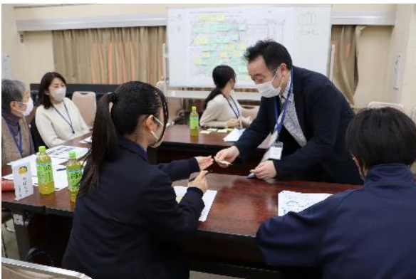
「ワールドカフェ」という、途中でグループメンバーをシャッフルする形式で実施することで、より多くの方と意見交換をしていただきました！

このニュースレターでは、当日のワークショップの様子やいただいたご意見をお伝えします！