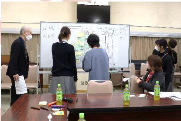
広場と区民交流スペースの平面図にアイデアを書いた付せんを貼っていきました。