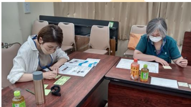
▲まずはアイデアを付せんに書いて.....

このニュースレターでは、当日のワークショップの様子やいただいたご意見をお伝えします！