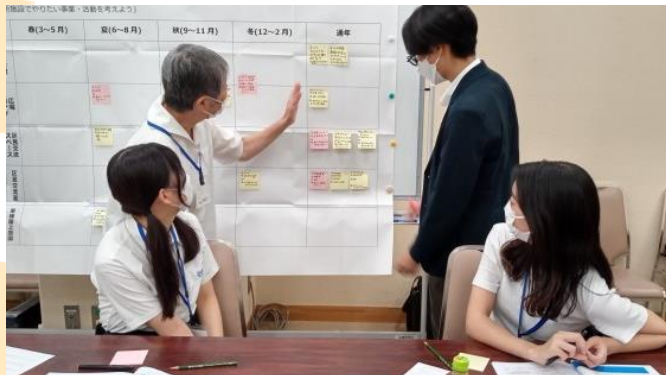
▲グループ内でシェアすることで、発想がどんどん広がっていきます。