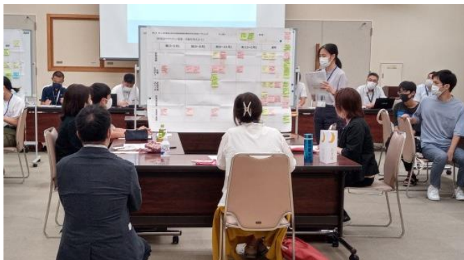
▲グループワークの内容は、ワークショップの最後に他のグループの方々に向けて発表していただきました。発表者のみなさん、ありがとうございます！